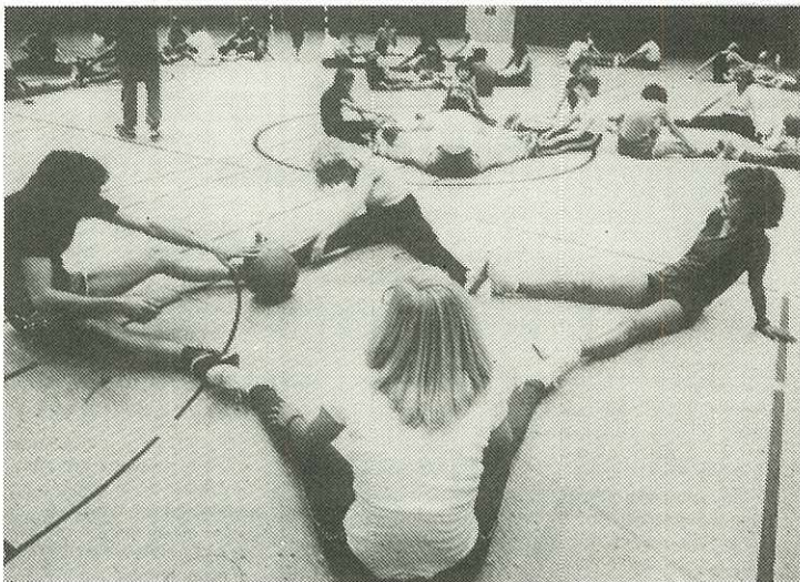
Idræt som folkeunderholdning – eller aktiviserende fritidsbeskæftigelse.

Det er min faste overbevisning, at det er nu, der skal vælges side, og at praksis derefter er sagen.